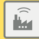
ГУДКИ ПРЕДПРИЯТИЙ И ТРАНСПОРТНЫХ СРЕДСТВ